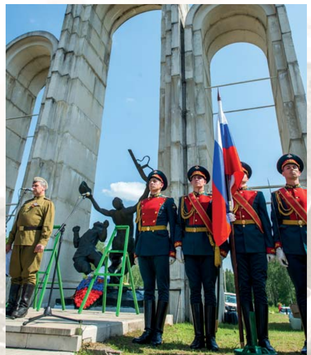
Мемориальный комплекс д. Барсуки

Память о тех далеких событиях навсегда останется неиссякаемым источником нравственной силы и созидательной энергии для новых поколений.