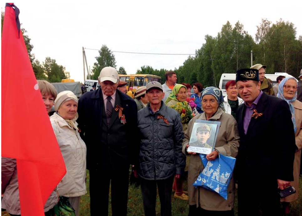
Члены Национально-Культурной Автономии Калужской области и гости из Татарстана у воинского мемориала в д. Барсуки, 23 июня 2014 г.

В этом движении принимает участие Региональная Татарская Национально-Культурная Автономия. Ак-