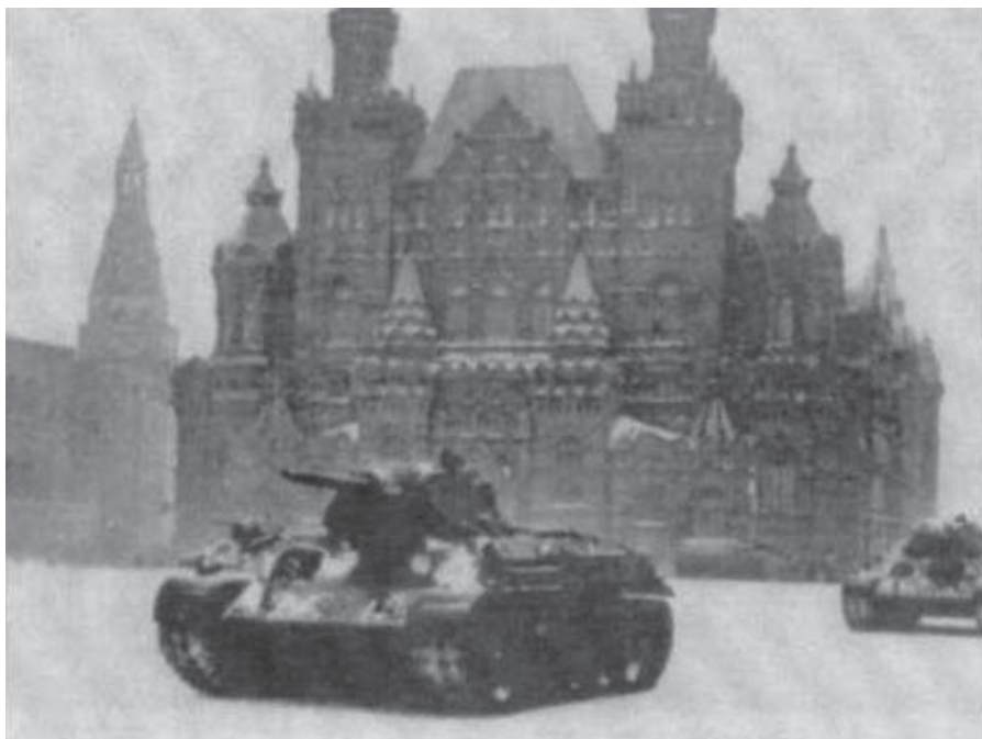
Парад войск Красной Армии на Красной площади Москвы перед отправкой на фронт. 7 ноября 1941 г.

Ранее упомянутая 146-я стрелковая дивизия, которой командовал