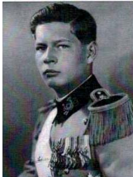
Михай I, король Румынии

ся в военкомат с просьбой «направить бить фашистов».