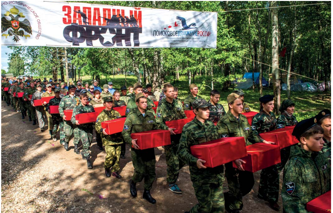
Торжественное захоронение найденных поисковиками останков советских воинов

нова к этому же периоду было выявлено более 11 430 уроженцев Татарстана, погибших на территории нынешней Калужской области. С тех пор мы значительно пополнили Книгу памяти Татарстана.