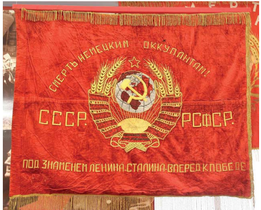
Знамя 608-го стрелкового полка 146-й стрелковой дивизии

В ходе Ржевско-Вяземской наступательной операции советских войск (2-22 марта 1943 года) были освобождены от немецко-фашист-