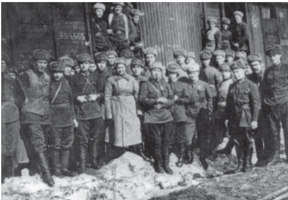
608 сп 146 сд перед отправкой на Западный фронт. Полк сформирован в г. Казани

Всего из 608-го полка были убиты 28 офицеров и очень много солдат, а