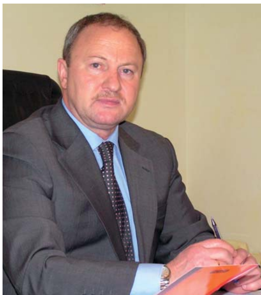
АХМЕТШИН РАВИЛЬ КАЛИМУЛЛОВИЧ

Заместитель Премьер-министра Республики Татарстан. Полномочный представитель РТ в Российской Федерации